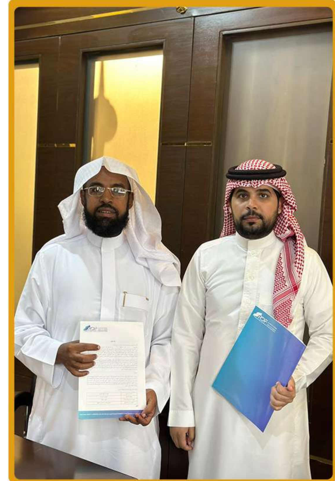
عقد اتفاقية لتمويل مشروع "وقف النور بمدينة الرياض" مع مؤسسة سليمان الراجحي