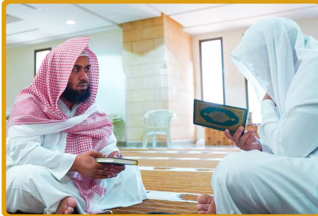
4 حلقة الموظفين