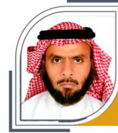
عضو مجلس الإدارة