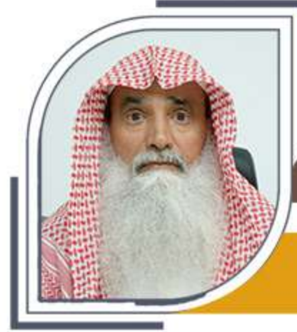
عضو مجلس الإدارة