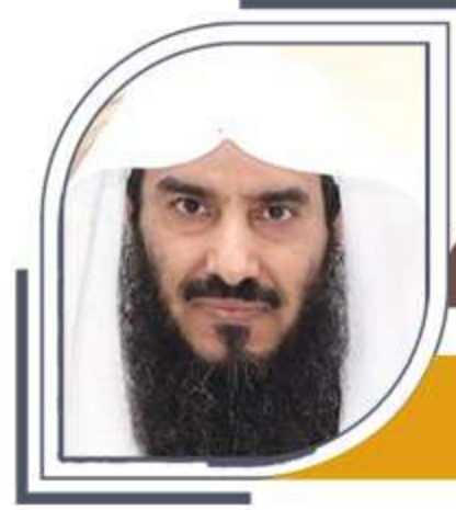
نائب رئيس المجلس