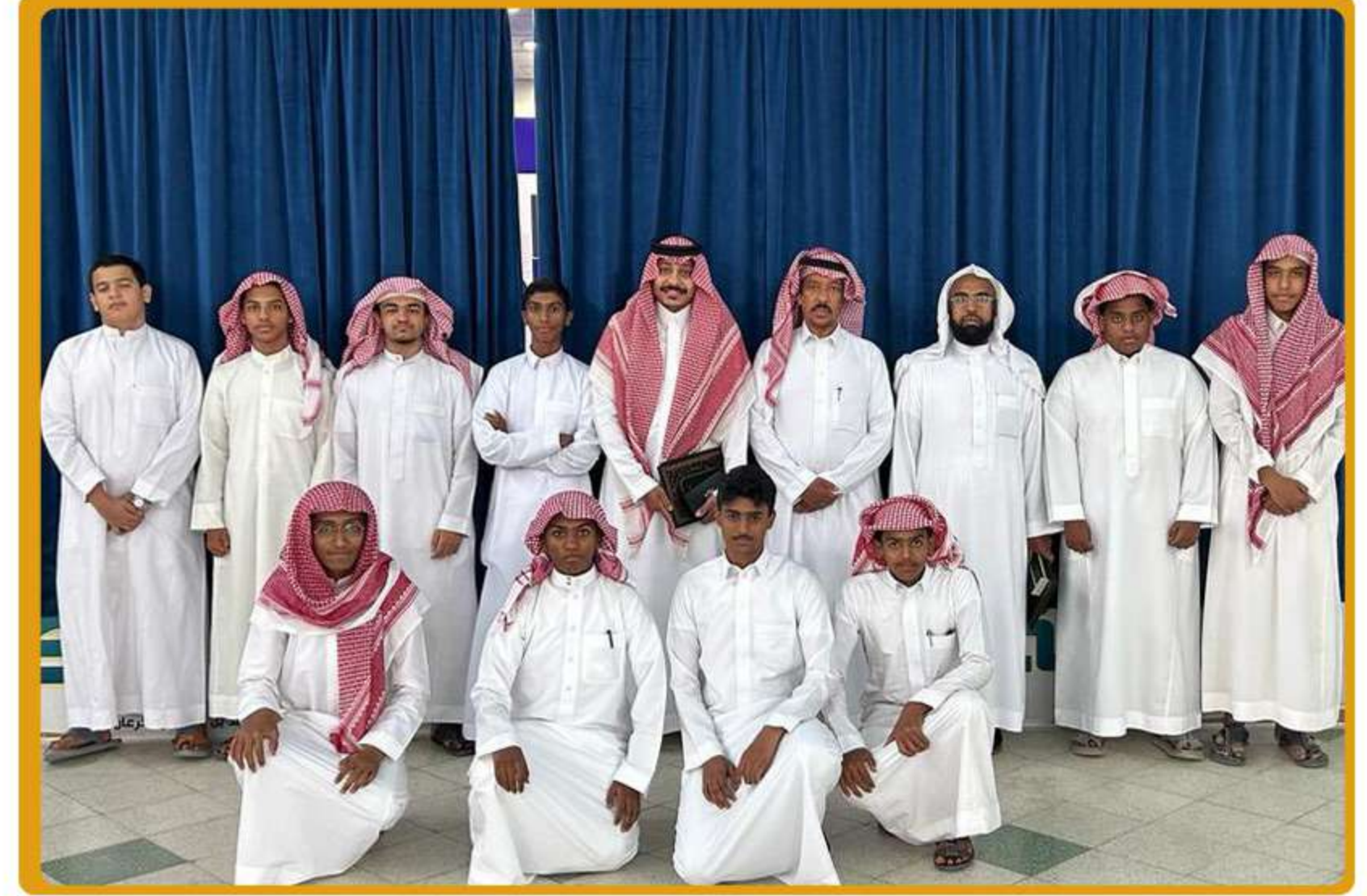
تم توقيع عقد شراكة مجتمعية بين الجمعية و ثانوية الملك فهد