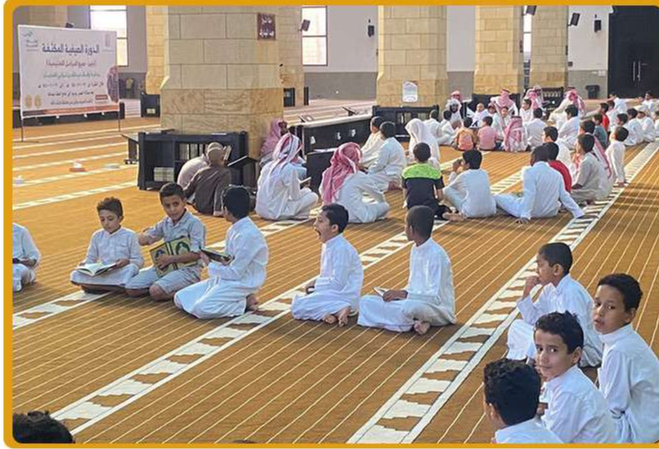
2 الدورة الصيفية