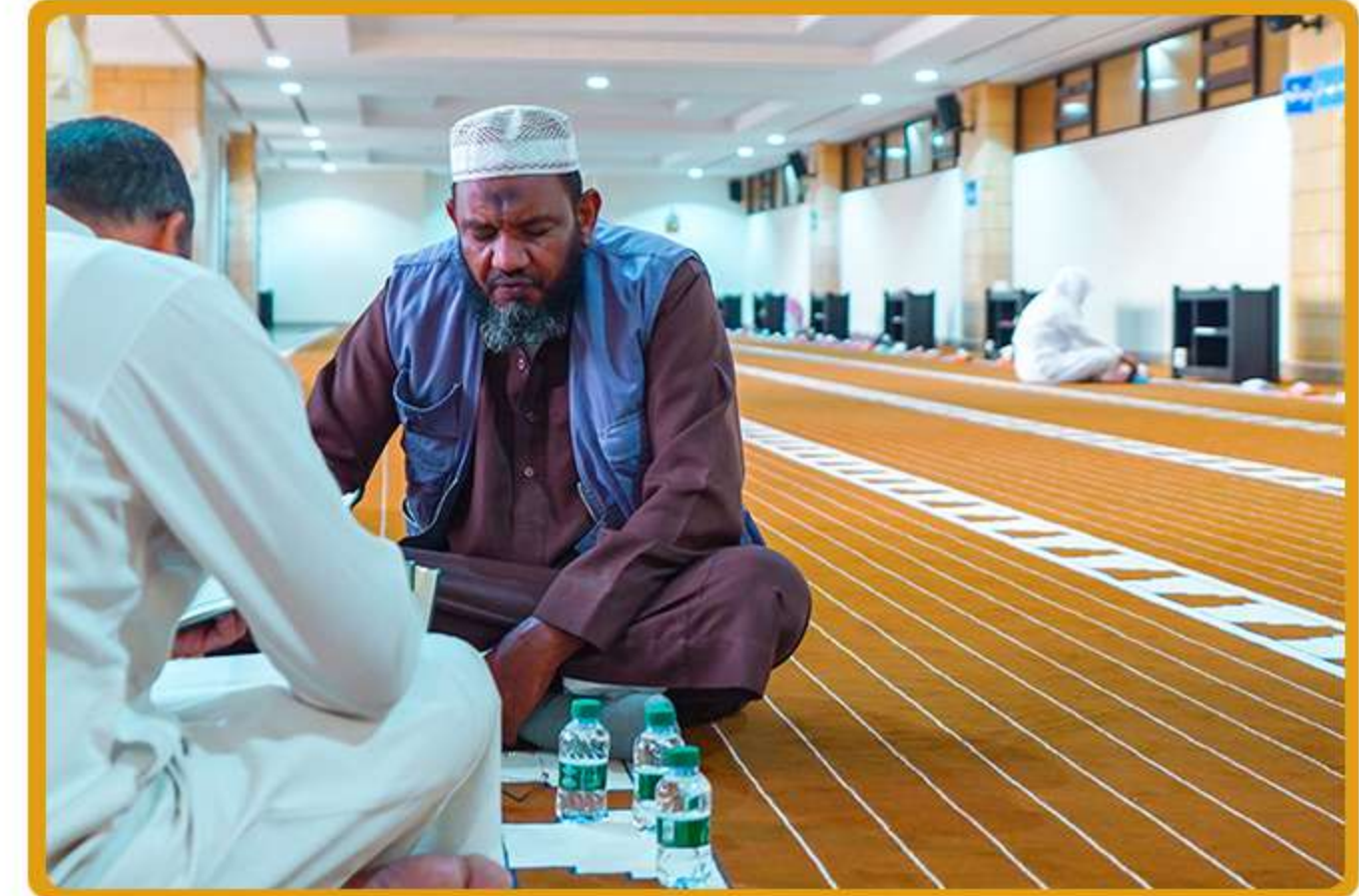
3 حلقة الجاليات