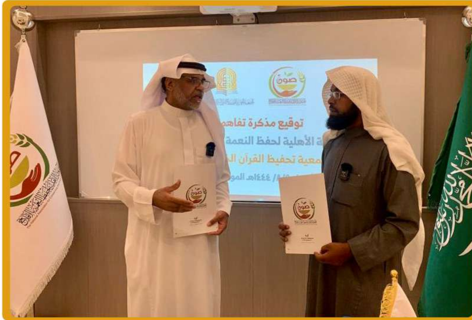
وقعت الجمعية عقد شراكة مجتمعية مع الجمعية الخيرية لحفظ النعمة (صون)