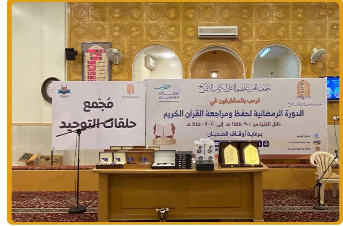
1 الدورة الرمضانية