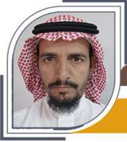
عضو مجلس الإدارة