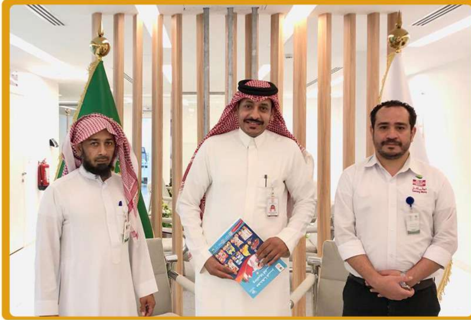
تمت زيارة وفد من أسواق عبدالله العثيم وذلك للاتفاق على بنود الشراكة المجتمعية