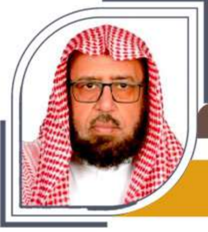
عضو مجلس الإدارة