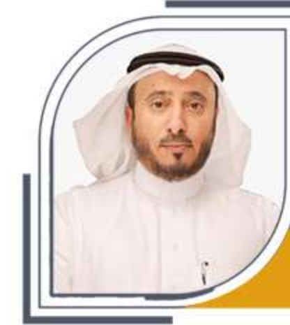
عضو مجلس الإدارة