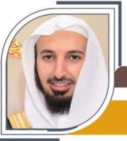
عضو مجلس الإدارة